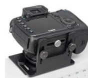
Universal-Foto- Adapter für Fotokamera (ohne Kamera)