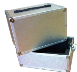
Transportkoffer für Basisgerät