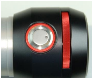
einfache Bedienung via Tastknopf/Dimmrad