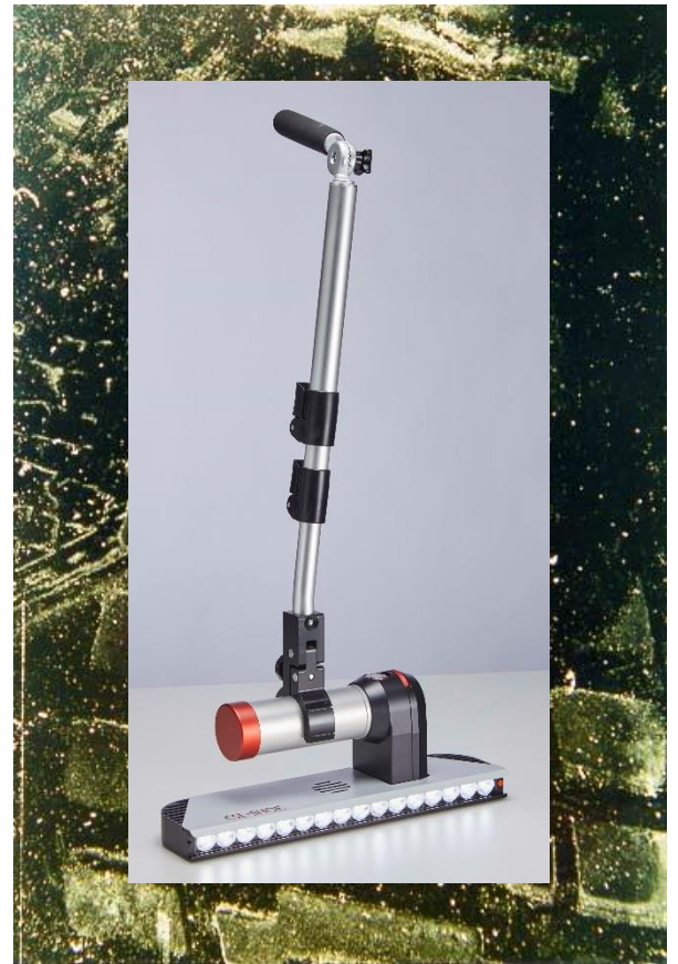
Teleskophalter zur Erleichterung der Spurensuche