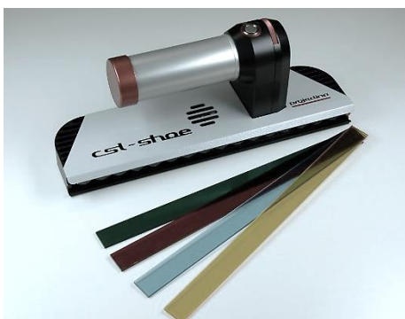
Filter rot, blau, grün und gelb zur Kontrasterhöhung, einschiebbar